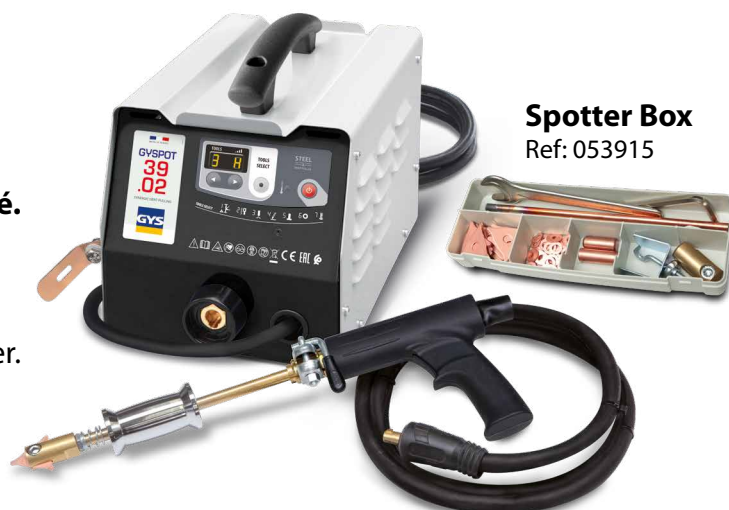
Spotter Box Ref: 053915

Le point de soudure est généré automatiquement par un simple contact entre l'outil et la pièce à redresser.