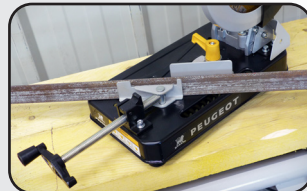
Etau réglable 45° Vise setting 45°