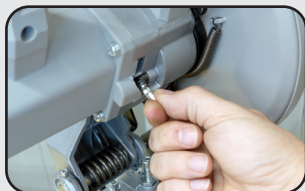
Blocage de l'arbre du disque Disc spindle locking